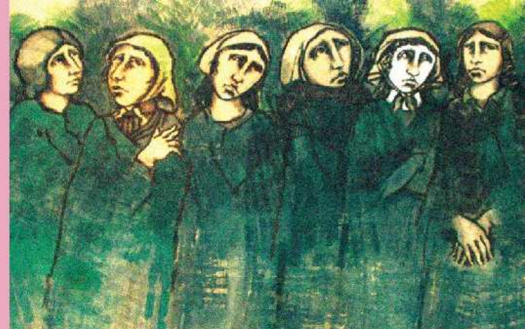
Imagen de tapa: Reproducción del Mural de "Madres y Abuelas de Plaza de Mayo", del artista uruguayo Jorge Errandonea. Utilizada como bandera en las marchas de la resistencia a la dictadura frente a la Embajada Argentina en París, su entrega a la Asociación de Abuelas de Plaza de Mayo para su exhibición en el Museo de la Memoria, se realizó en el Consejo Superior de la UNLa, donde hoy se exhibe la reproducción.